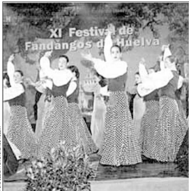
Imagen de la última edición del Festival de Fandangos

Los presos políticos del franquismo en L'Hospitalet pueden dirigirse a cualquiera de las tres oficinas de Bienestar Social de la Generalitat ubicadas en la ciudad para presentar la documentación y rellenar un impreso.