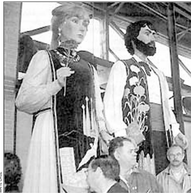
La tradición de los gigantes ha llegado a Bélgica