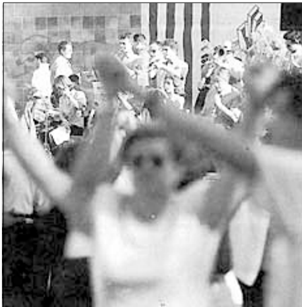
L'Aplec de la Sardana se celebra a Can Buxeres