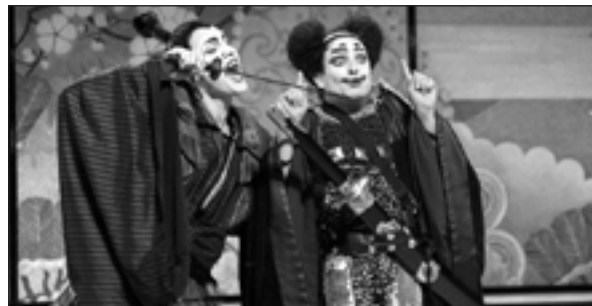
Dagoll Dagom torna a posar en escena el Mikado

En el mateix període de temps, el Centre Cultural Barradas ha passat de 5.696 espectadors a 6.550, amb una ocupació mitjana del 55%. Sanz ha manifestat que en total les dues sales municipals han acollit més de 29.000 assistents la temporada 2005-2006. "L'augment ha anat paral·lel a l'ampliació d'espectacles que han passat de 68 a 80", ha dit. # MARGA SOLÉ