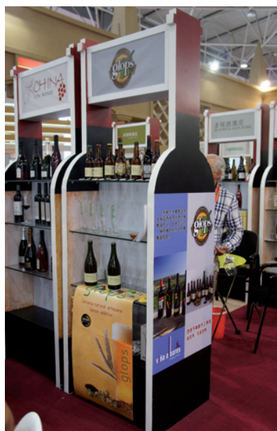
A l'esquerra, l'estand de Glops a la Xina; a la dreta, els propietaris de Sutran mostren els seus productes