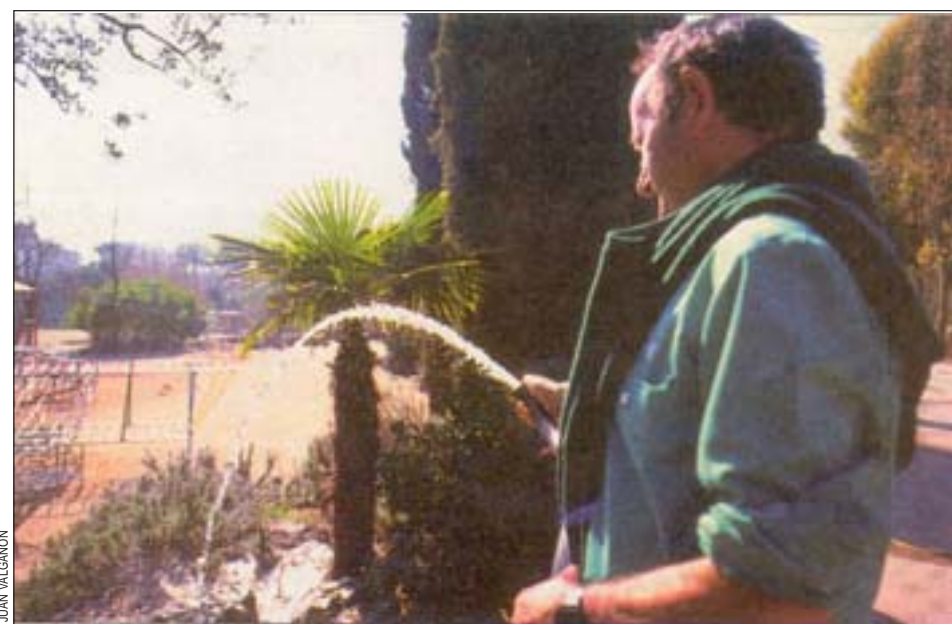
L'Hospitalet es el primer municipio de Catalunya que regará con agua del subsuelo