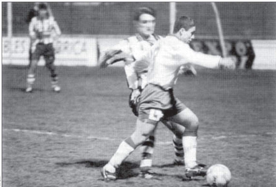
El Hospi ha iniciado la segunda vuelta ganando, en el último minuto, al Gandía en el municipal

La llegada del técnico Ramón Moya ha supuesto un cambio considerable en el juego del CE L'Hospitalet. El equipo ha concluido la primera vuelta de la segunda B en la mitad de la tabla y, aunque los resultados han sido irregulares, el fútbol que ha ofrecido merece todos los elogios. Moya ha conseguido conjuntar un bloque joven