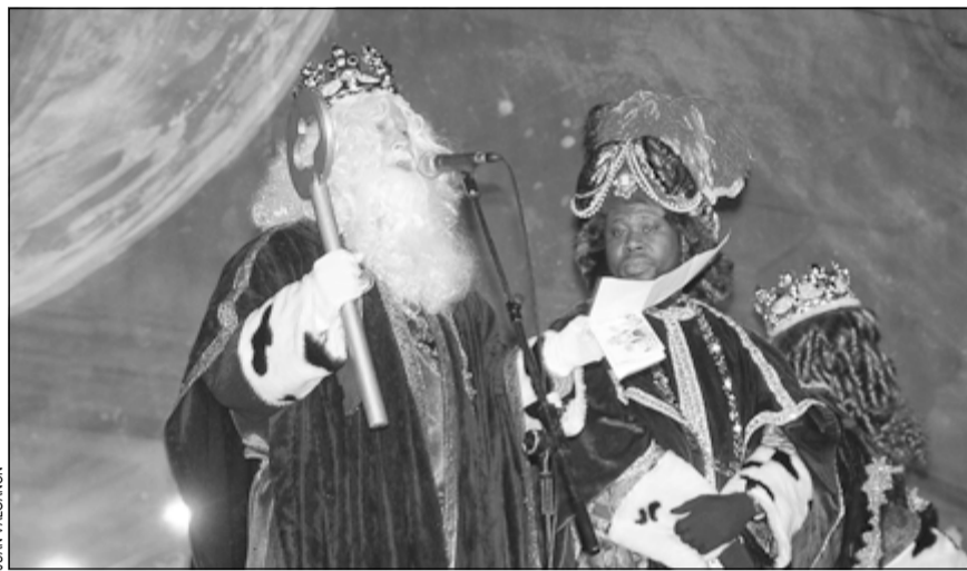
Els Reis Mags en el moment de rebre les claus de la ciutat el passat Nadal