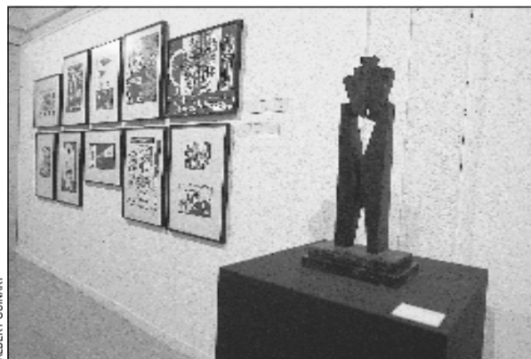
La col·lecció d'art de L'Hospitalet hi serà exposada fins al 9 de gener