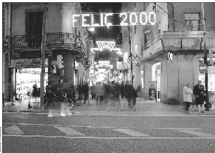
25.000 bombetes il·luminen els carrers de la ciutat per Nadal