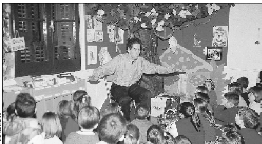
L'hora del conte a la biblioteca de Santa Eulàlia