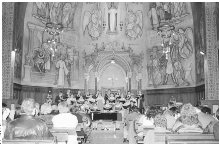
Imatge del concert de Nadal de 1997 amb El Cant de la Sibila