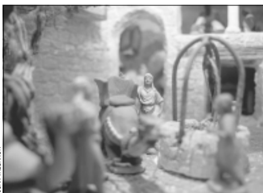
Un dels pessebres de la mostra de l'anterior edició, també al Barradas