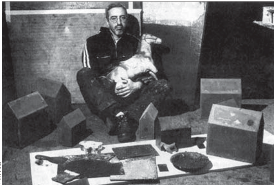
Els treballs d'Agustín Fructuoso es podran veure del 30 de maig al 2 de juliol a la Sala Molí

El Centre Cultural Tecla Sala, consolidat com un dels espais d'art de Catalunya més reconeguts, continua amb la seva tasca decidida de difondre l'art que ens toca de més aprop, el que fan els artistes locals i del Baix Llobregat. La propera proposta passa per l'art d'avantguarda de l'artista local Agustín Fructuoso i del cornellenc Ricard Vaccaro. El primer ocuparà la Sala Molí del 30 de maig al 2 de juliol, i el segon, la Sala 1, del 8 de juny al 16 de juliol