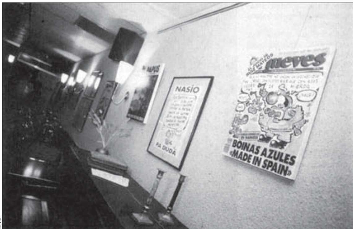
Un aspecte de l'exposició del dibuixant Ivà que es pot veure al Bagdad Café