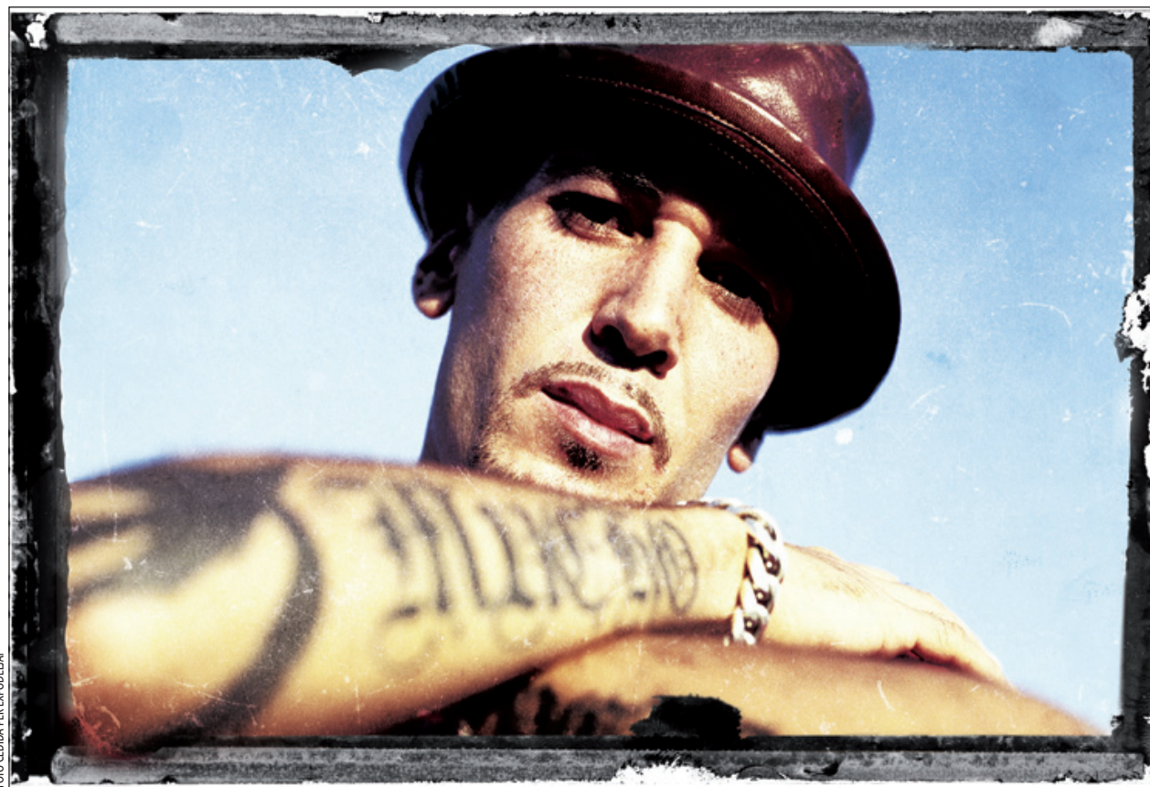
Mucho Muchacho actuarà en una matinal de hip-hop