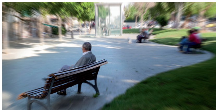
Avinguda de la Primavera

Quin és el teu lloc emblemàtic de L'Hospitalet? Explica'ns a www.digital-h.cat aquell lloc on jugaves amb els amics, aquella parada del mercat on sempre et donaven alguna cosa per tastar, aquell banc del passeig on feies manetes. L'HOSPITALET publica una selecció dels millors comentaris i fotografies dels llocs que triïs.