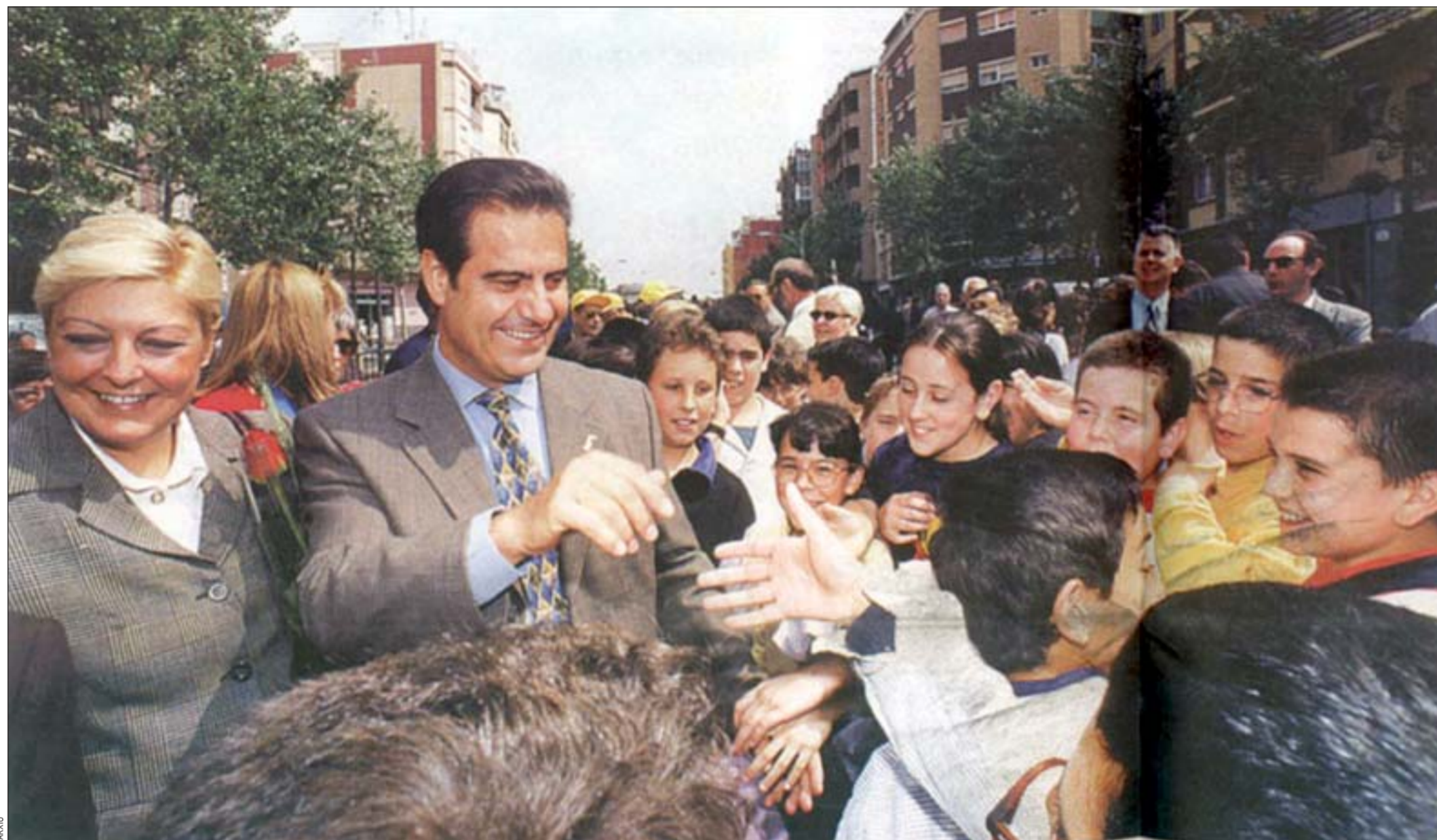
Preparar la ciudad para abordar el futuro y dar respuesta a las nuevas generaciones es uno de los retos que L'Hospitalet tiene planteados

El alcalde hace balance y habla de los proyectos en marcha