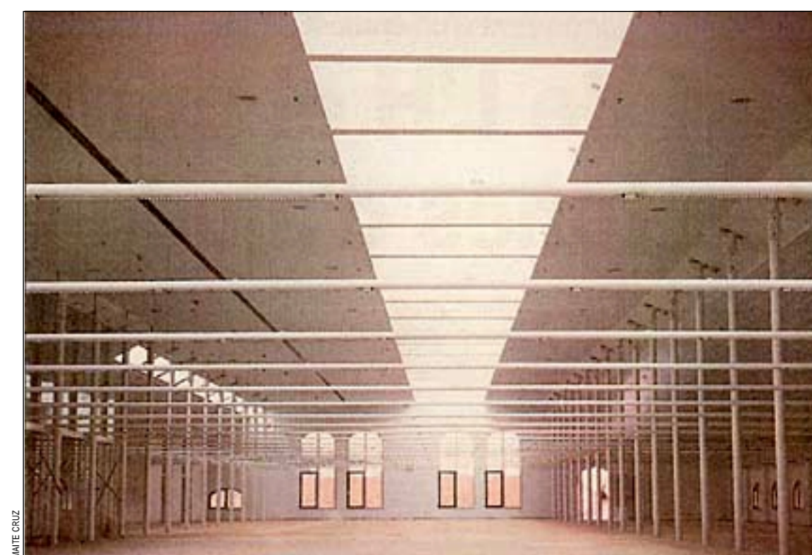
Aspecto de la planta superior donde se ubicarán parte de las instalaciones de la Biblioteca Central