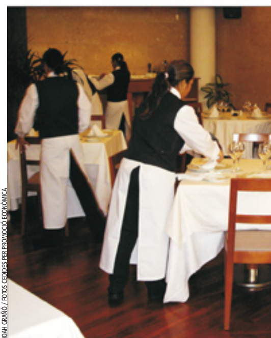
NOHÍ GRANO