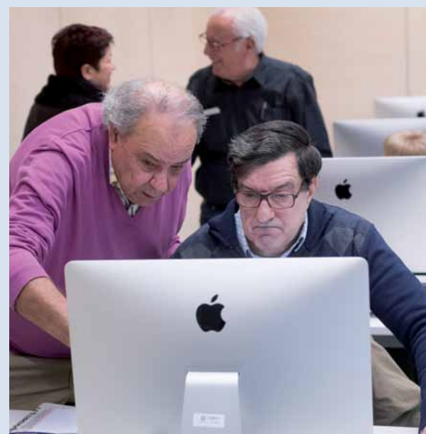
Curs del taller de formació digital i competències escolars a Torre Barrina