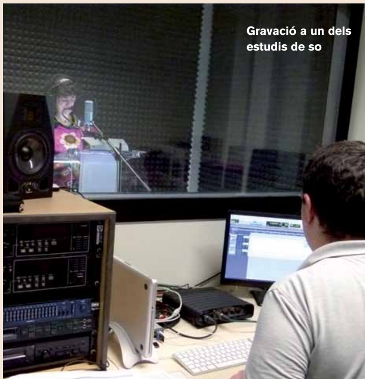
Gravació a un dels estudis de so

I la formació cultural és una de les darreres incorporacions al programa formatiu a través del curs sobre música digital que organitza la Biblioteca Josep Janés.