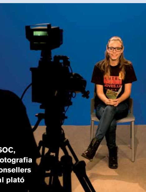
SOC, fotografia consellers el plató