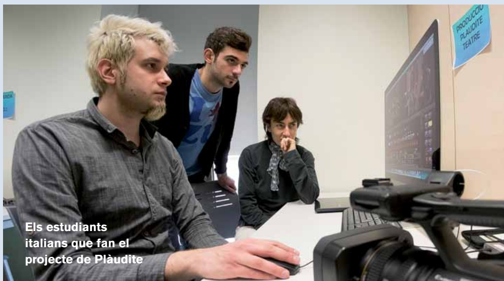
Els estudiants italians que fan el projecte de Plàudite

lo és l'única producció que es du a terme al centre del parc de la Marquesa. L'Escola de Música-Centre de les Arts està col·laborant amb l'Institut Margarida Xirgu i un documental sobre el fet migratori i