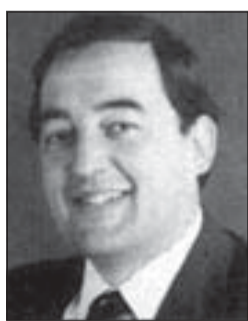
Joan Rosell President de Foment del Treball