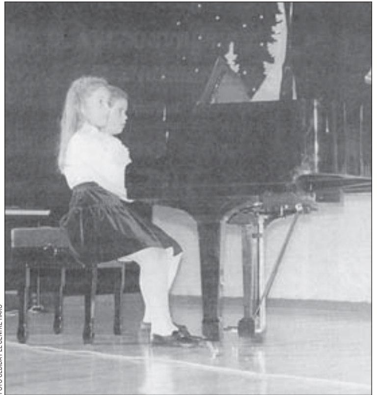
La mostra vol potenciar l'activitat musical de L'Hospitalet

combina amb una gran sensibilitat i amb rigor en la textura, el color i la composició, l'acrílic sobre tela i/o sobre fusta majoritàriament, encara que també es troben altres materials com la corda. Per la mostra s'ha seleccionat a més un rellieu de fusta datat al 1960.