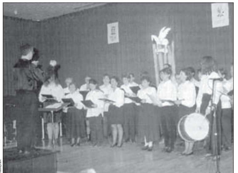
Un total de quatre conjunts corals van actuar al Barradas

Musicoral 96 ha tingut set escenaris diferents. La mostra de