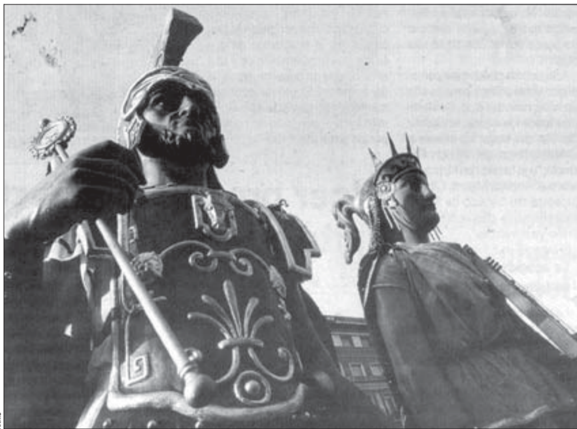
Las fiesta mayores de L'Hospitalet incluyen encuentros de gigantes

Se acerca el verano y con él las fiestas mayores de los barrios de L'Hospitalet. Después de Las Fiestas de Primavera, las de toda la ciudad, inaugurarán la temporada el barrio de Santa Eulàlia seguido de Can Serra y de Collblanc-La Torrassa, que coincidirán en el tiempo. Bellvitge cerrará la temporada en septiembre