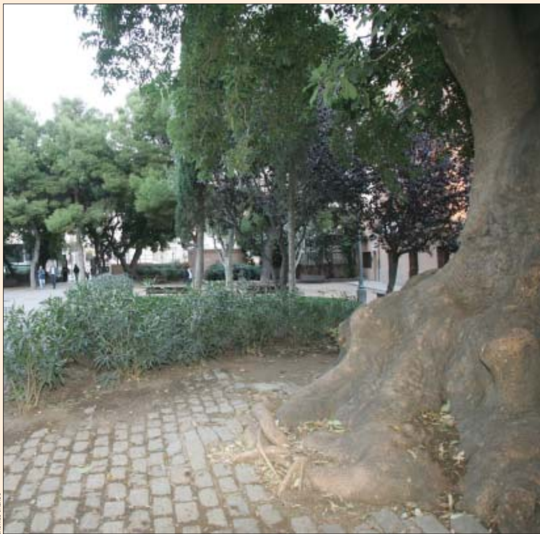
Estado actual del parque de la Marquesa

Lo singular de este proyecto es la estructura del aparcamiento. Aunque realmente tiene tres plantas, las rampas de comunicación entre estas superficies tienen una inclinación mínima (in-