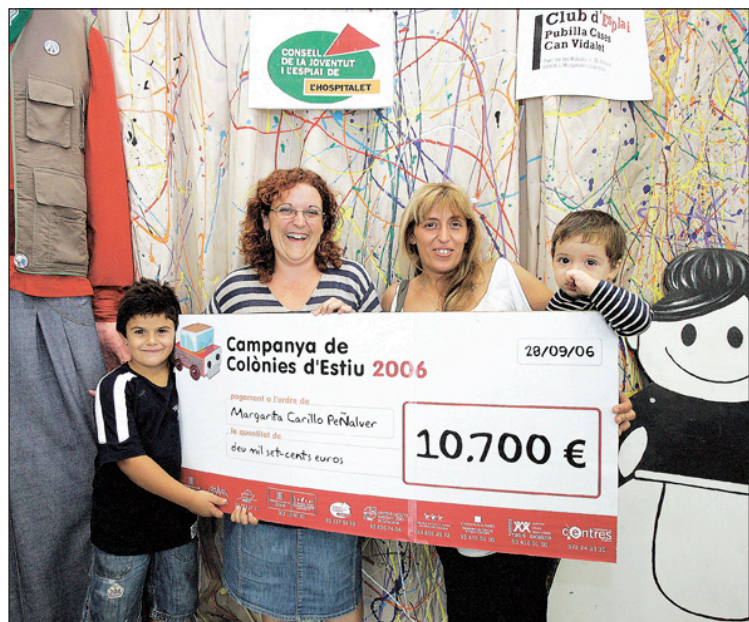
Moment del lliurament dels premis als guanyadors de l'edició 2006