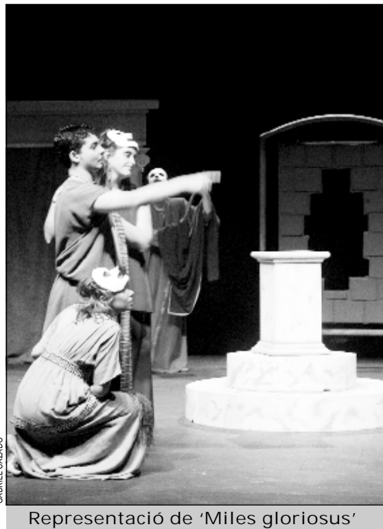
Representació de 'Miles gloriosus'