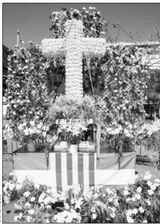
La cruz decorada con flores

La cofradía 15+1 celebró el pasado día 4 la tradicional celebración de la Cruz de Mayo que se inició con la exposición de la cruz, adornada por las hermanas de la entidad, en la plaza de la Bòvila para después continuar con una procesión con la imagen de Nuestra Señora Virgen de los Remedios. La jornada finalizó con un festival de entidades en la misma plaza. La Cruz de Mayo es una más de las tradiciones que anualmente celebra la cofradía, junto con las procesiones de Semana Santa. Consiste en decorar con flores una cruz que se expone durante todo el día y en el que participan las hermanas cofrades. # REDACCIÓN