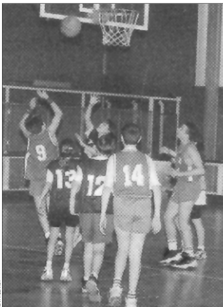
Los escolares han iniciado ya las competiciones deportivas