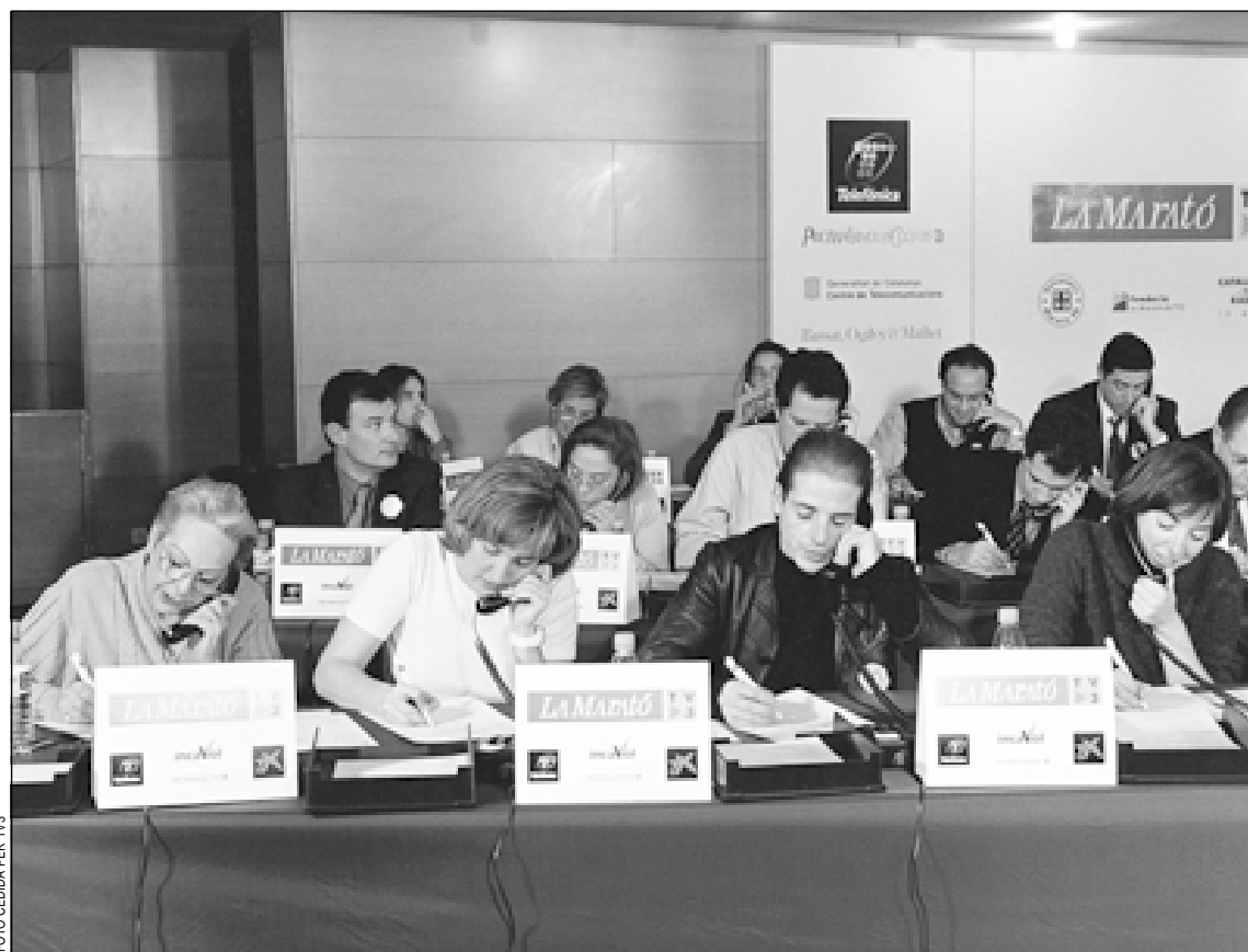
Els famosos col·laboren amb la Marató de TV3 rebent les aportacions telefòniques dels ciutadans

De la Marató de TV3 se n'han fet ja set edicions, i amb els anys s'ha convertit en una autèntica festa de la solidaritat dels catalans. La Marató d'enguany es dedicarà