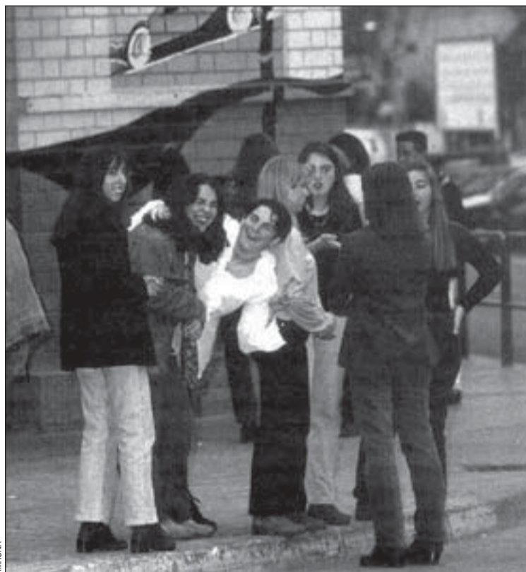
L'oci nocturn a les ciutats va ser tema de debat a L'Hospitalet

Segons els participants del seminari, les polítiques de prevenció han de buscar l'equilibri entre el dret al descans i a les formes d'esbarjo. Una altra de les conclusions de la trobada és que els programes que es portin a terme han de tenir un caràcter multidisciplinar, agrupant actuacions de la policia, la justícia i l'ensenyament, entre d'altres. El seminari també ha ressaltat que és necessària la poten-