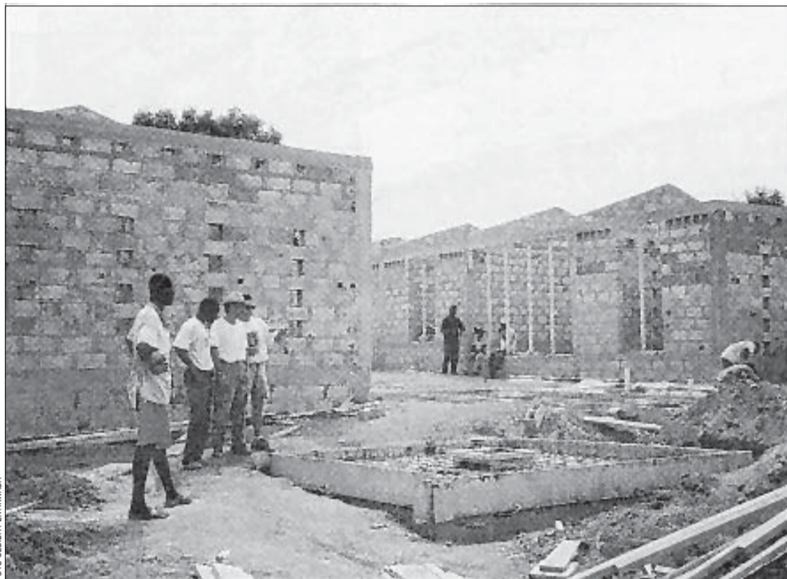
Akwaba, una de las entidades integrantes del consejo, desarrolla proyectos en Costa de Marfil