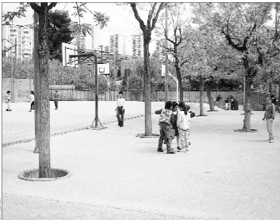
Las instalaciones escolares esperan la llegada de los nuevos matriculados

Para facilitar la decisión a los padres, los centros educativos suelen celebrar jornadas de puertas abiertas durante las cuales se visitan las instalaciones, se explican las características de la escuela, los servicios que ofrece y el ideario docente, esto en cuanto a la