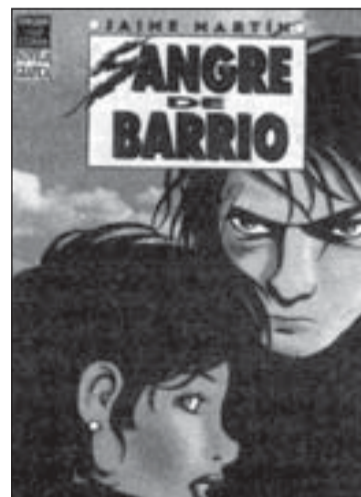
Portada de Sangre de Barrio