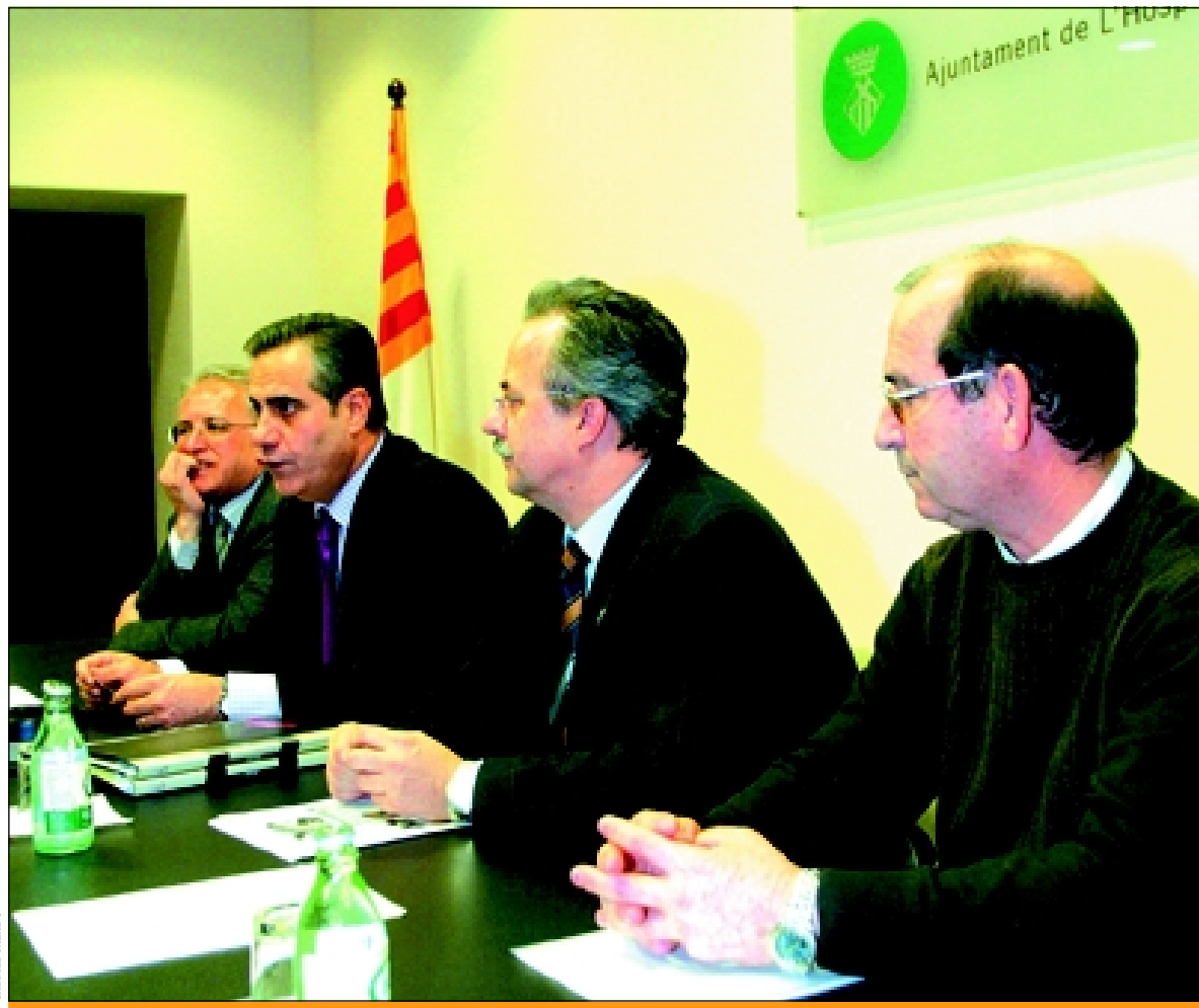
Els veïns entreguen les signatures a l'alcalde

La plataforma de veïns considera prioritària la construcció del poliesportiu ja que és important pel barri i no malmeta el valor històric del casc antic de la ciutat