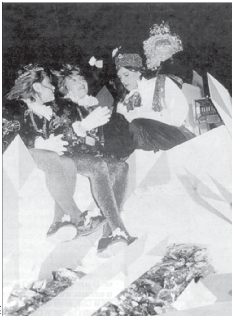
La cavalcada dels Reis Màgics i la mostra de pessebres, dos de les tradicions que es recuperen a la ciutat per aquestes dates