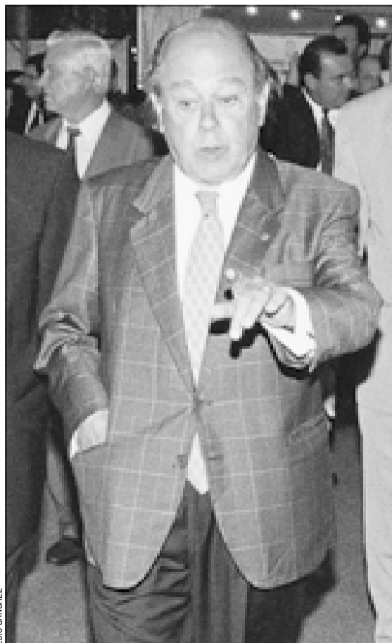
Jordi Pujol y Pasqual Maragall hicieron llegar sus propuestas electorales a los hospitalenses

La Fiesta Mayor de Bellvitge, que se celebró en la primera quincena de septiembre, fue uno de los marcos elegidos por los candidatos en estos comicios para pasear por L'Hospitalet. Este fue el caso del presidente de la Generalitat y candidato a la reelección, Jordi Pujol, y el candidato por el PSC, Pasqual Maragall.