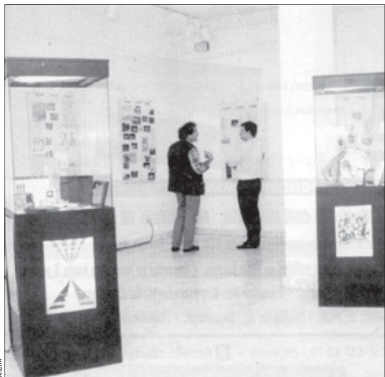
El Barradas va acollir una mostra de la història de l'entitat

30 de noviembre 22h. AC La Florida. Camàlics i Amics ( folk -fusión).