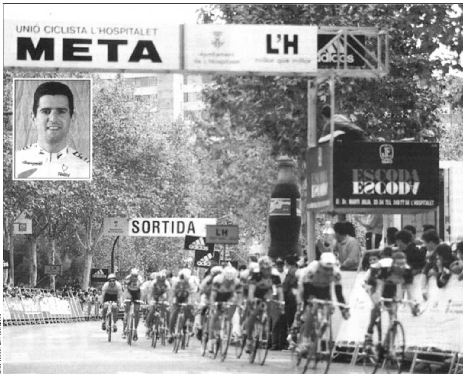
Olano participará en la presente edición del Criterium que se disputará en el circuito de la Rambla de la Marina

La de este año es la 23ª edición del Criterium. La prueba empezó a disputarse en el año 1969 y se hizo de forma ininterrumpida hasta 1980. Después sufrió un parón hasta 1988, en que se reemprendió la organización. En los últimos años han inscrito el nombre en su palmarés ciclistas de la categoría de Alvaro Pino, Pedro Delgado o Miguel Indurain.