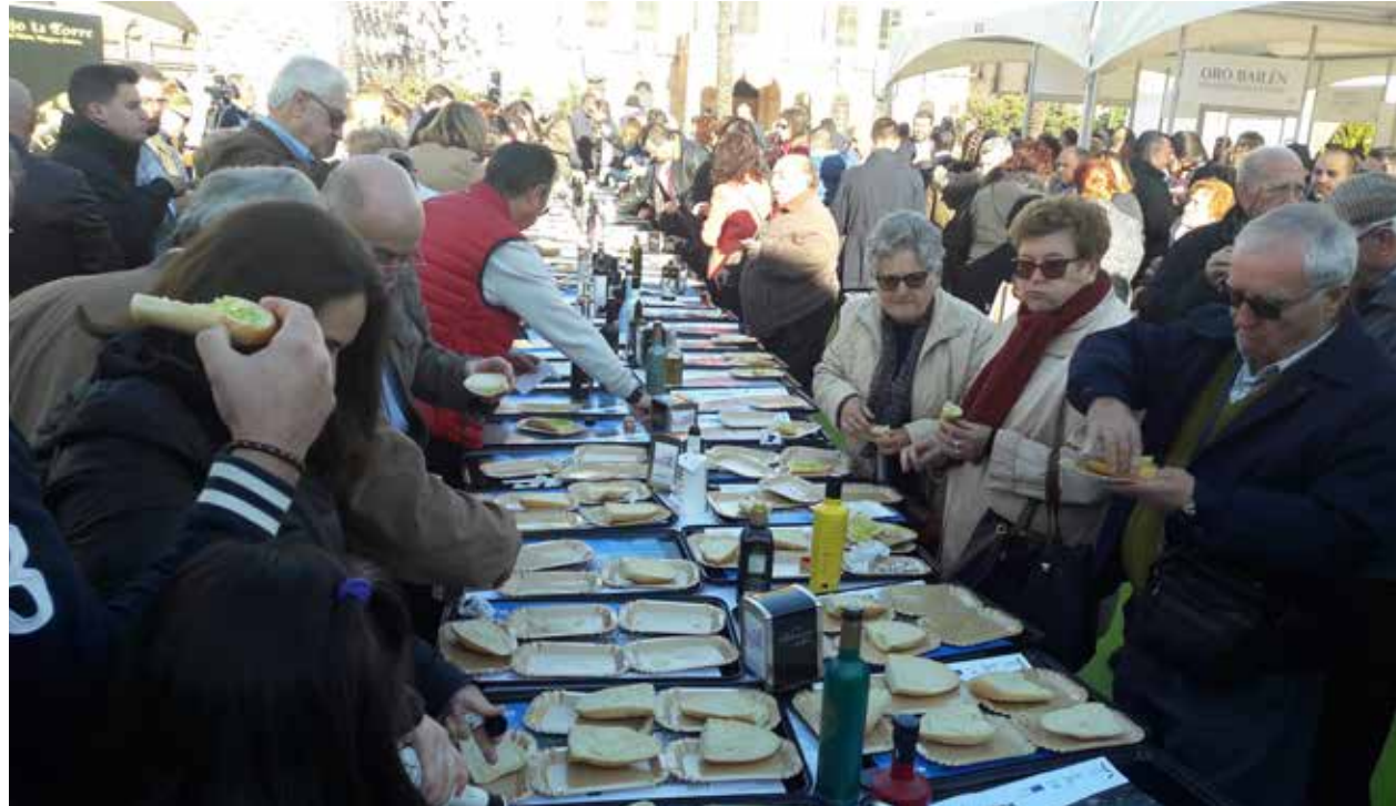
Fiesta del Primer Aceite de Jaén celebrada en Linares en 2017

El viernes y el sábado, de 10 a 20h, se realizarán catas de aceite, desayunos populares, degustaciones de productos locales y demostraciones gastronómicas a cargo de