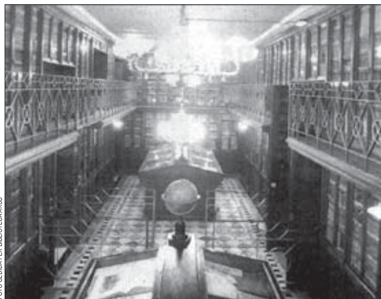
El centre de lectura ocupa un important edifici noucentista

Amb la beca, de 500.000 pessetes i dirigida als hospitalencs, es pretén elaborar la història de la biblioteca, aprofundint en el context en que apareix i estudiant el seu fons bibliogràfic. Els interessats han de presentar abans del 9 de novembre un projecte detallat de l'estudi i en el termini d'un mes el jurat emetrà el veredict. El treball,