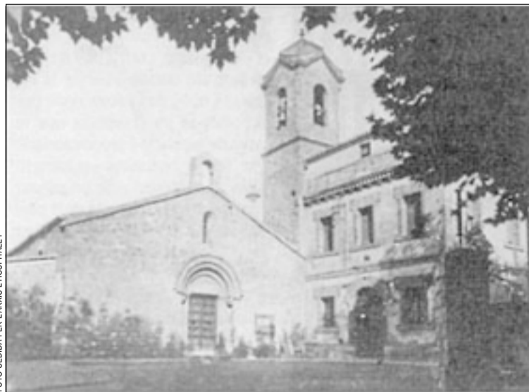
L'església romànica l'any 1935 abans de la guerra civil