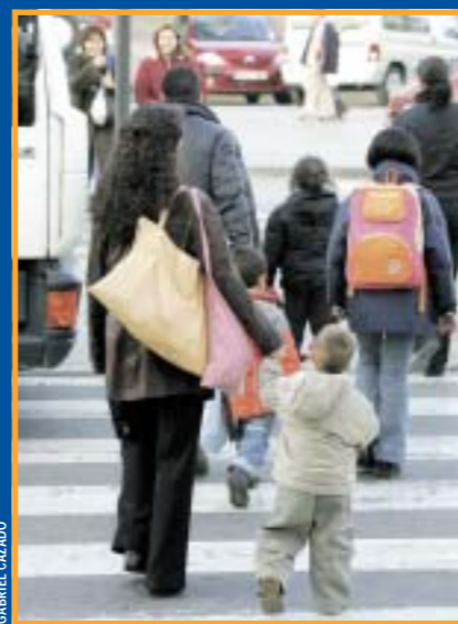
El camino escolar seguro comporta una mejora generalizada de las infraestructuras