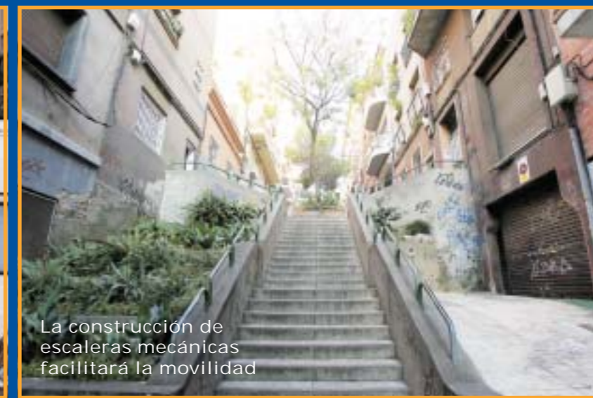
La construcción de escaleras mecánicas facilitará la movilidad