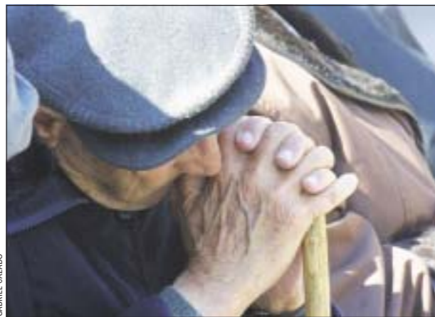
El distrito tendrá un nuevo casal d'avis

Por su parte, los grupos políticos presentes en el Ayuntamiento también habían aprobado unánimemente pedir las ayudas de la Ley de Barrios para Collblanc-la Torrassa.