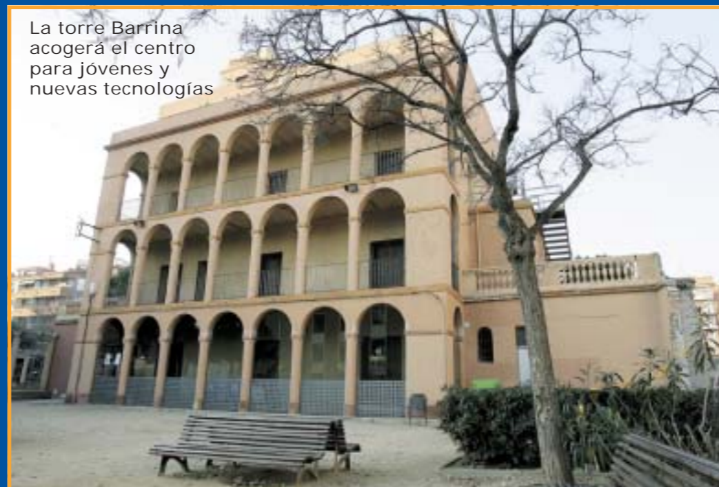
La torre Barrina acogerá el centro para jóvenes y nuevas tecnologías