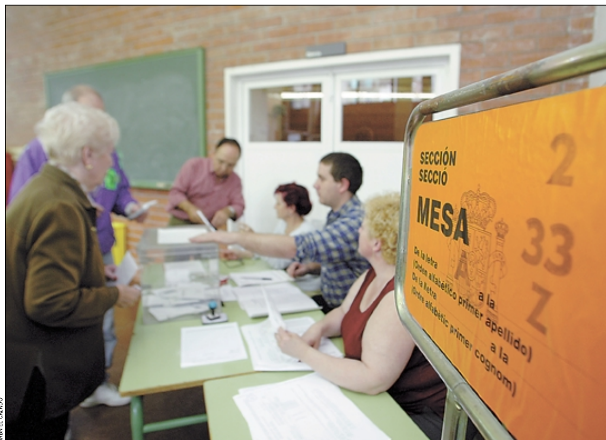
La jornada electoral transcurrió con normalidad a pesar de la lluvia

Verda, a 2.392 (2,24%) en 2003. El Partido Humanista desciende (de 188 votos a 159) y Una Altra Democràcia És Possible se ha estrenado con 305 sufragios.