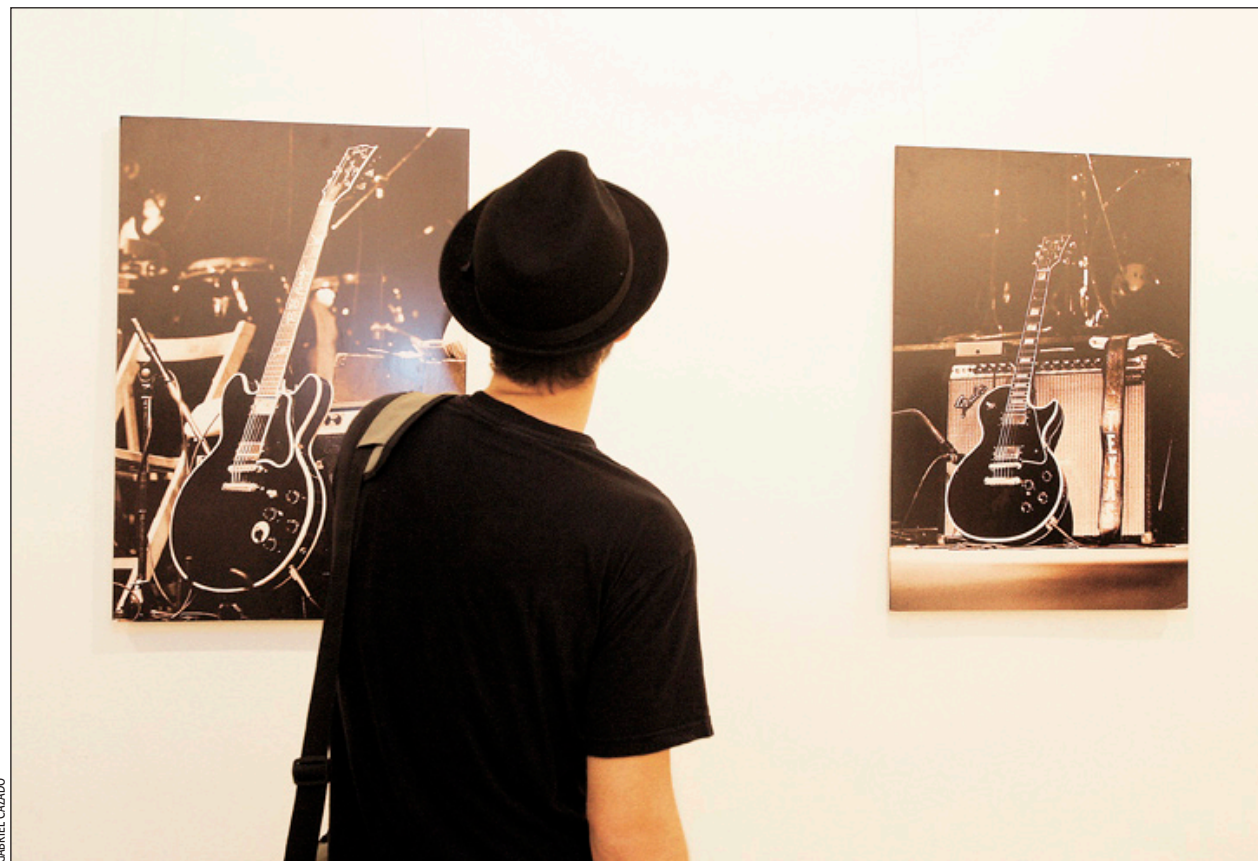
Exposició de fotografies de Jordi Vidal al Centre Cultural Collblanc-la Torrassa

Pel que fa a les conferències, s'han previst dues a la biblioteca Tecla Sala relacionades amb diferents