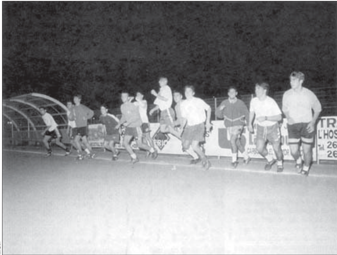
Las entidades deportivas preparan sus respectivas canteras y esperan obtener buenos resultados

En baloncesto, el CB L'Hospitalet, el BC Tecla Sala y el Aracena AE L'Hospitalet volverán a tener opciones de clasificarse para las fases finales de los campeonatos de Catalunya y España. Hasta el momento, los equipos cadete e infantil masculinos del CB L'Hospitalet son los que mejor papel están realizando. Los cadetes