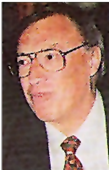
Jordi Solé Tura

Vint anys de Constitució analitzats per un dels seus ponents