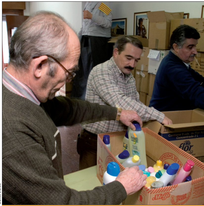
Recollida de material higiènic destinat als refugiats