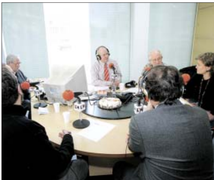
Un moment del programa d'aniversari