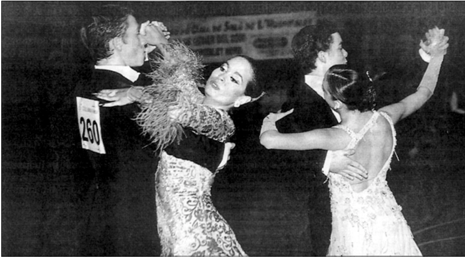
Cerca de 400 parejas participaron en este Primer Trofeo de Bailes de Salón en el polideportivo L'Hospitalet Nord