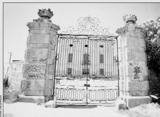
Masía de Can Rigalt

El alcalde afirmó que Can Rigalt forma parte del plan integral previsto para el barrio. "Se hará lo que convenga a L'Hospitalet y a Pubilla Casas, será el ensanche natural de este barrio y se estudiará desde esta perspectiva". Corbacho no descartó la construcción de viviendas en Can Rigalt "si se llega a la conclusión de que esto es lo que necesita Pubilla Casas pero lo que no está en discusión es que habrá zonas verdes y equipamientos". El alcalde afirmó también que "si las actuaciones en Can Rigalt coinciden con otras propuestas de otras ciudades muy bien, pero si no es así se hará lo que se decida en L'Hospitalet".