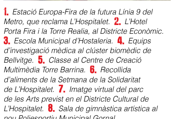
1. Estació Europa-Fira de la futura Línia 9 del Metro, que reclama L'Hospitalet. 2. L'Hotel Porta Fira i la Torre Realia, al Districte Econòmic. 3. Escola Municipal d'Hostaleria. 4. Equips d'investigació mèdica al clúster biomèdic de Bellvitge. 5. Classe al Centre de Creació Multimèdia Torre Barrina. 6. Recollida d'aliments de la Setmana de la Solidaritat de L'Hospitalet. 7. Imatge virtual del parc de les Arts previst en el Districte Cultural de L'Hospitalet. 8. Sala de gimnàstica artística al nou Poliesportiu Municipal Gornal

L'economia i la cultura són els dos motors de transformació