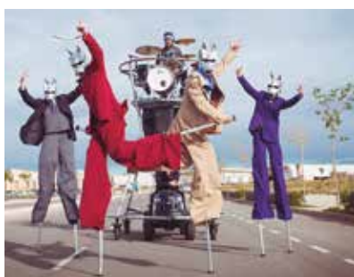
CEDIDA PER CULTURA