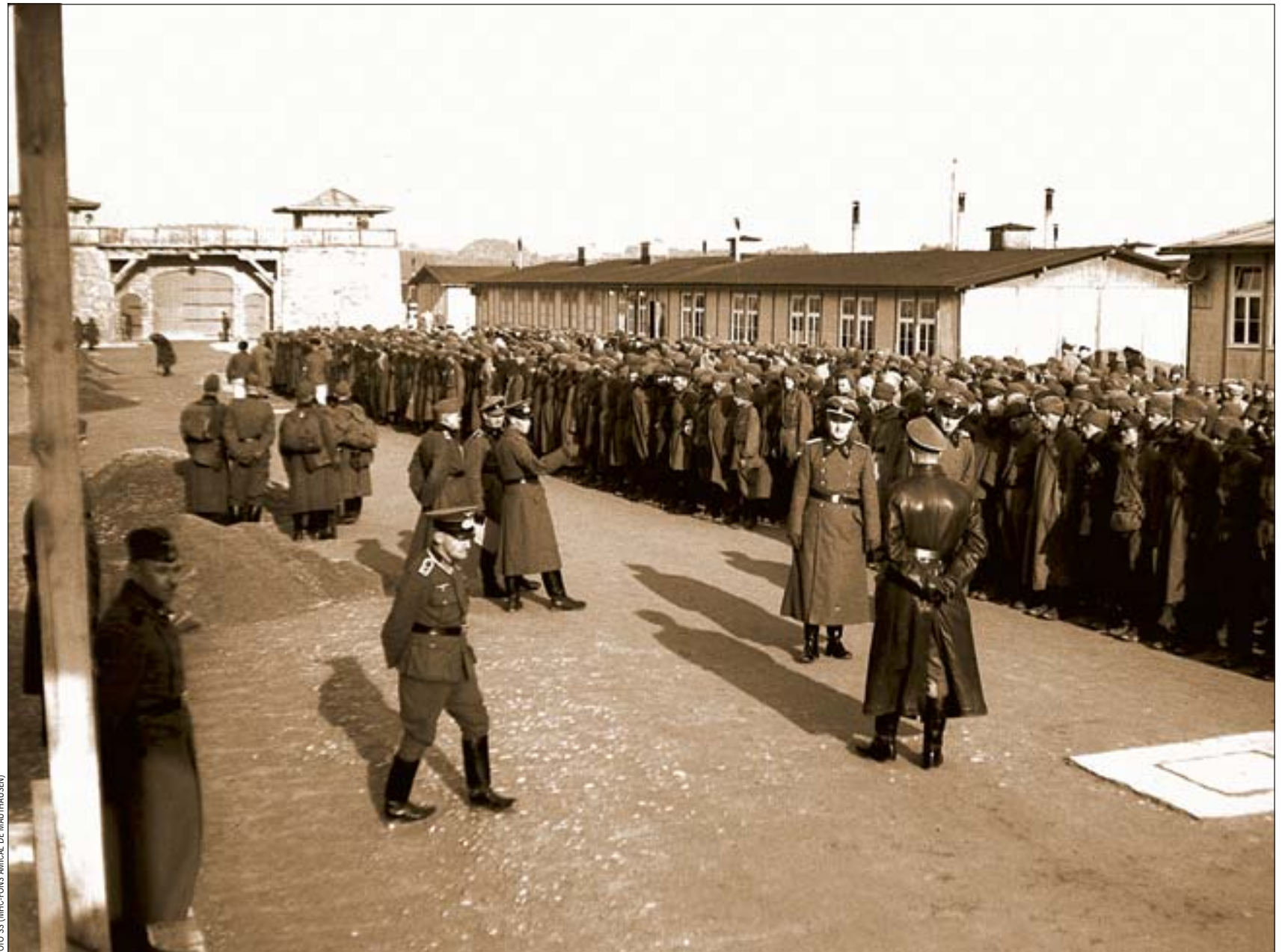
Entrada de presoners soviètics a Mauthausen, cap a l'octubre del 1941. L'arribada era un xoc per als deportats.

L'entrada al camp de Mauthausen era igual de brutal que el viatge que acabaven de fer. Per exemple, del comboi de més de 800 espanyols del 13 de desembre del