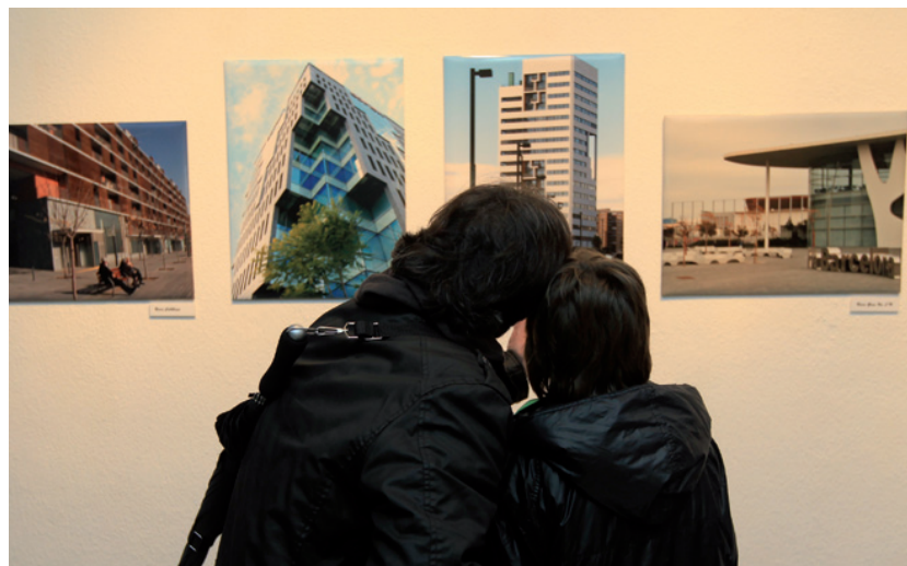
Una parella observa les instantànies exposades de Foto Viva

L'entitat Foto Viva, amb seu al barri de Sanfeliu, ha organitzat una exposició amb motiu del seu 25è aniversari a l'Auditori Barradas. La mostra recull els treballs més significatius realitzats al llarg d'un quart de segle per aquest grup d'aficionats a la fotografia. L'exposició, que es presenta sota el títol de 25 anys d'imaginació , es pot visitar fins al 10 d'abril. ■