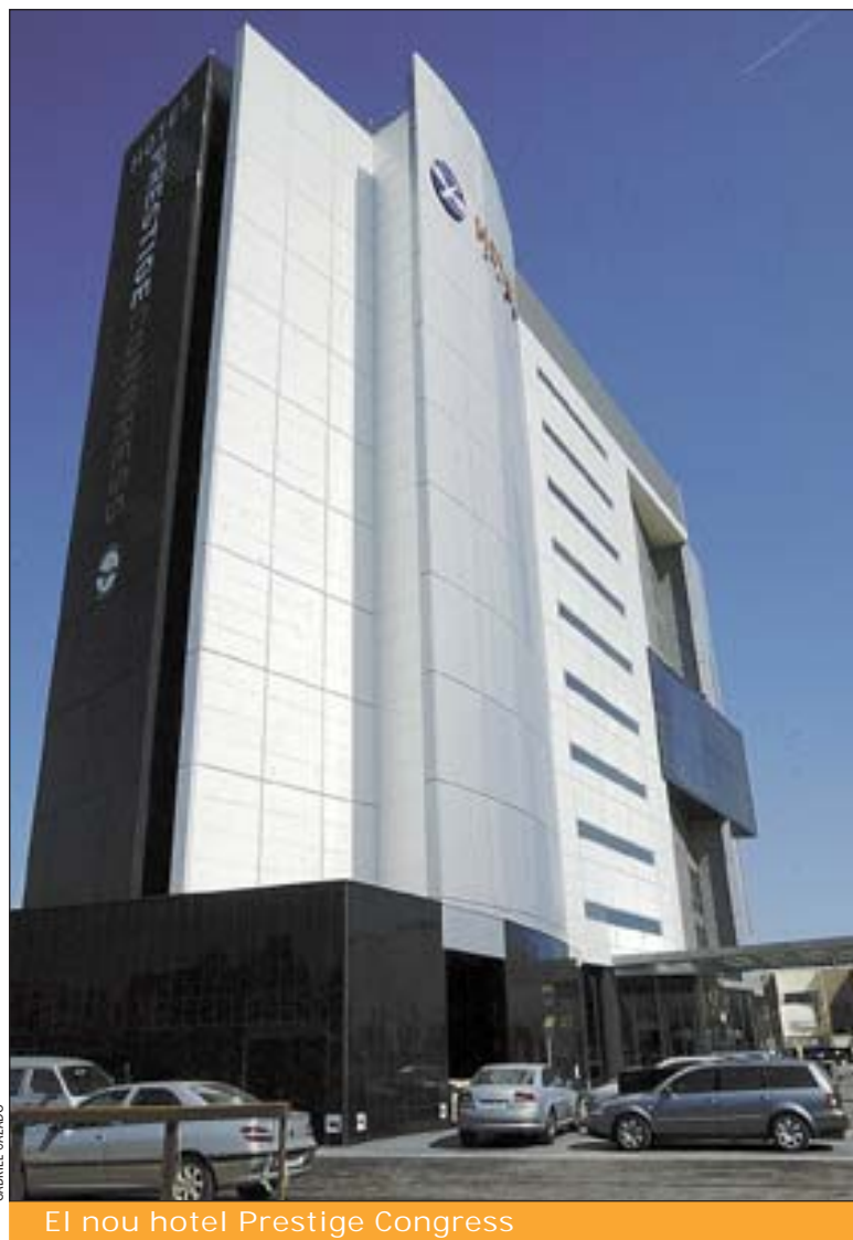
El nou hotel Prestige Congress

A l'hotel és possible la transformació del dormitori en despatx en tan sols deu minuts mercès al disseny del mobiliari, disposa de servei de Shuttle Moving , per organitzar trasllats diaris des de l'establiment a l'aeroport o a on sigui necessari, i per un