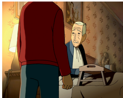
Imatge de la pel·lícula 'Arrugas'

visita interactiva a l'exposició La muntanya de sal , al Centre d'Art Tecla Sala, i les rutes de memòria històrica de les biblioteques Josep Janés i Can Sumarro.