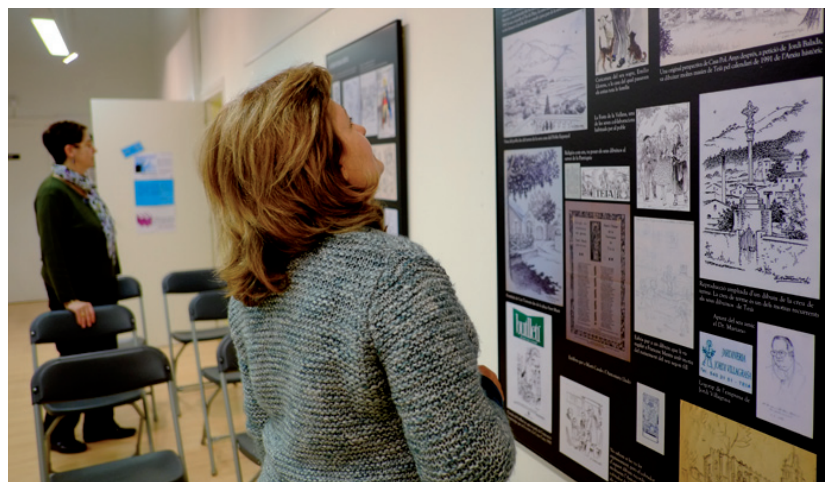
Exposició del dibuixant Antoni Batllori a Can Sumarro