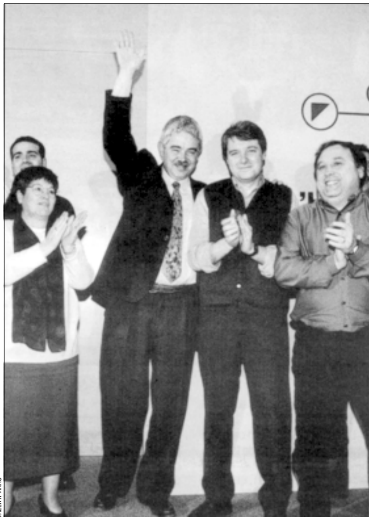
Maragall junt a representants sindicals a La Farga

Per al candidat dels socialistes, s'ha de tornar el poder als ajuntaments i donar-los altres que no han tingut mai, tot combinant el treball de les escoles, les empreses i sindicats, i els ajuntaments. "Ja veureu en el que es convertirà una Catalunya basada en el poder local i el que es pot fer a partir dels ajuntaments", va afegir.