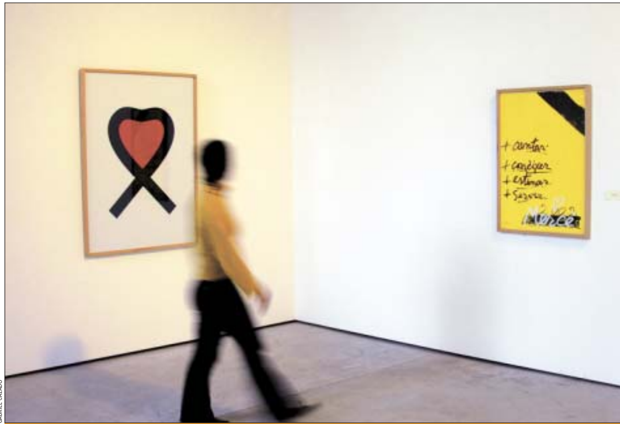
Dos dels cartells que es poden veure a l'exposició del Tecla Sala

Els cartells mostren un recorregut per diverses èpoques històriques i artístiques, i permeten apre-